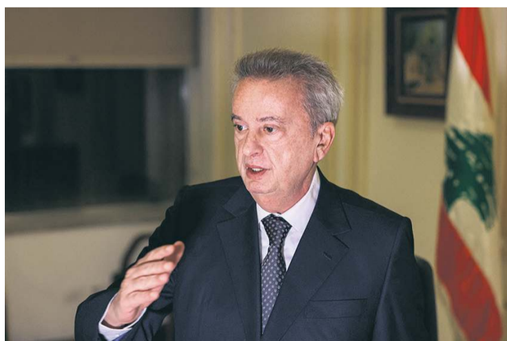
Riad Salamé en décembre 2021 à Beyrouth.

Un rapport de 2016 attribué à Cristal Group international, une société spécialisée dans l'intelligence économique établie à Lyon, a joué le rôle de déclencheur. Lorsque le contenu de ses 12 pages fuite dans la presse libanaise en 2020, le scandale éclate. Riad Salamé est accusé